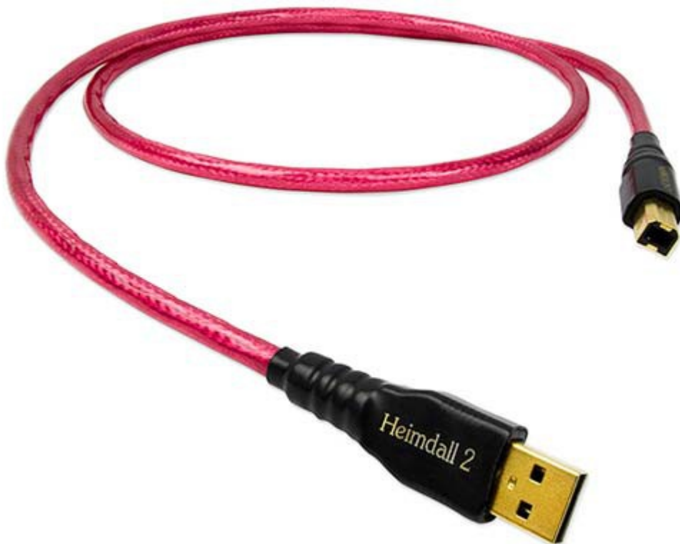
Nordost Heimdall 2 USB