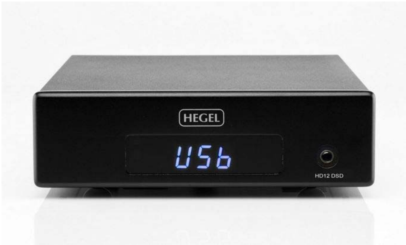
Hegel HD12 DSD

Új szelek fújnak a norvég gyártónál is, bár inkább lehetne szellőnek hívni, mint viharos szélnek. A tradicionálisan csak sztereó berendezéseket készítő Hegel, ha lassan is, de legalább következetesen újítja meg DAC kínálatát. Óvatos duhaj, nem nála jelennek meg legelőször a legújabb technológiák, mert a céljuk minden esetben a hangminőség javítása. Ennek ellenére bőven kiérdemlik az innovatív jelzőt, gondoljunk csak az általunk is nagyon várt 160-as erősítőjükre!